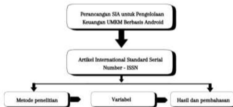
Gambar 1 : Kerangka Konseptual